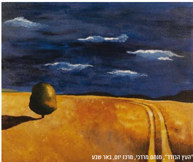
"העץ הבודד", מנחם מרדכי, מרכז יום, באר שבע