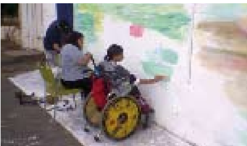
חברי המרכז מפגינים את כישוריהם