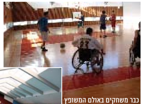
כנר משחקים באולם המשופץ