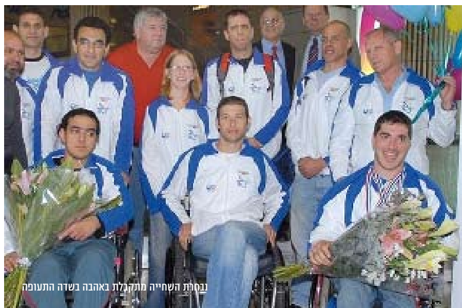
נבחרת השחייה מתקבלת באהבה בשדה התעופה