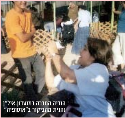
הודיה החברה במועדון איל"ן ונהיית מהביקור ב"אוטופיה"