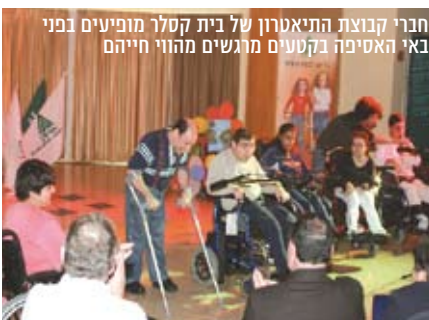
חברי קבוצת התיאטרון של בית קסלר מופיעים בפני באי האסיפה בטקסים מרגשים מהווי חיייהם