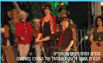
נהנים ומתרגשים מהחוויה חברות הזמר ולהקות המחול של המרכז בהופעה