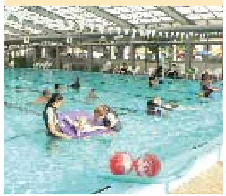
חניכי המרכז חונכים את הבריכה המקורה

מ אות מחברי מרכז הספורט הפעילים בענף השחייה יוכלו מעתה להשתמש בבריכת השחייה שבמרכז גם בעונת החורף, לאחר שהסתיים פרויקט קירוי הבריכה החיצונית. הפרויקט כולל גם הכנסת מערכת מיזוג אוויר, המחממת את חלל האוויר בשטח המקורה ומאפשרת למתרחצים, ובהם ילדים ובני נוער הרגישים לקור, מעבר נעים מחדרי ההלבשה לבריכה גם במזג אוויר חורפי וקר.