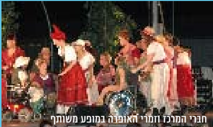
חברי המרכז הזמרי האופרה במופע משותף