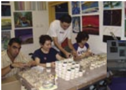
העבודה בחנות מרכז היום