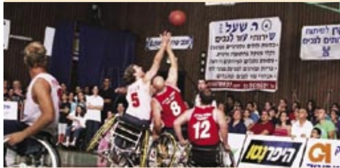
⬇️ קבוצת איל"ן רמת גן בפעולה