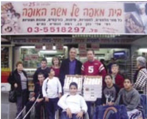
תמונה קבוצתית בבית המאפה